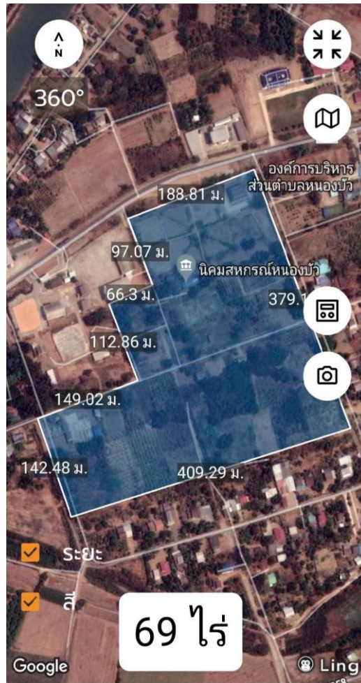
(๕) นิคมสหกรณ์ศรีสำโรง ตำบล สามเรือน อำเภอศรีสำโรง จังหวัดสุโขทัย